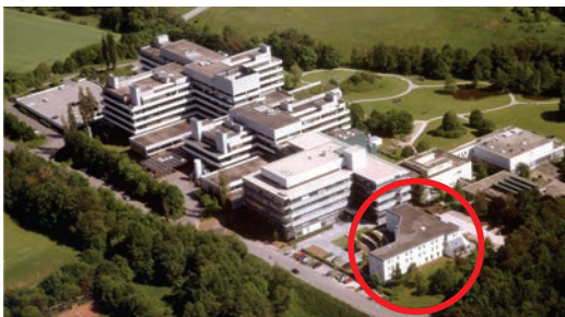
Stuttgarter Luftbild Eilsäßer GmbH